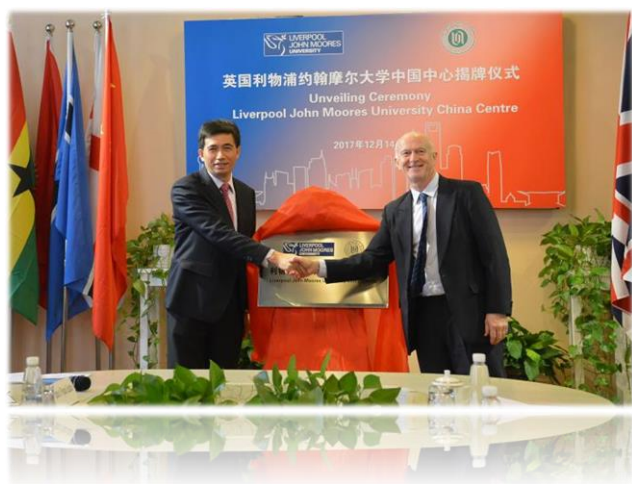
校党委书记滕建勇与英国利物浦约翰摩尔大学校长 Nigel Weatherill 为利物浦约翰摩尔大学中国中心揭牌